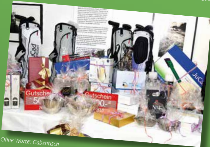
Ohne Worte: Gabentisch