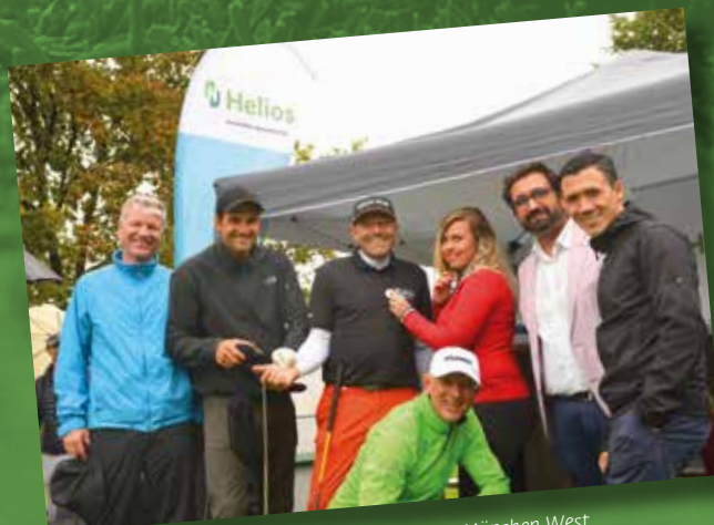
Beliebt: Die Blutdruck-Base des Helios Klinikum München West