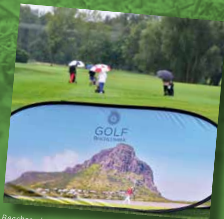
Beachcomber präsentierte das „Wahrzeichen“ Le Morne auf Mauritius. Die Golf-Woche Anfang Februar ist jeweils ein Hit...!