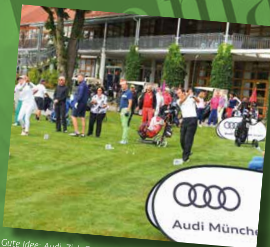
Gute Idee: Audi-Ziel-Contest vor dem Clubhaus