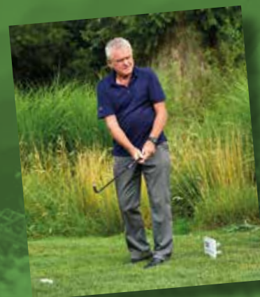
Vorbild: Sepp Maier