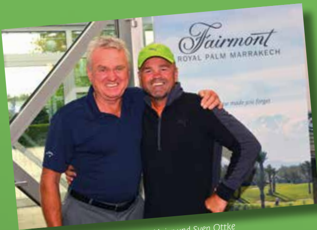
Köner mit Hcp 7,1 und 9,4: Sepp Maier und Sven Ottke