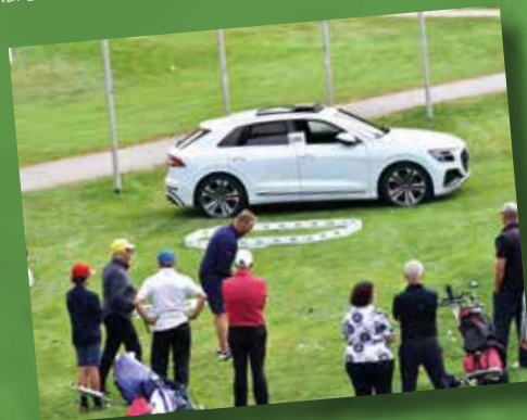
Attraktion: Der neue Audi Q8 feierte bei der TOP Trophy Premiere