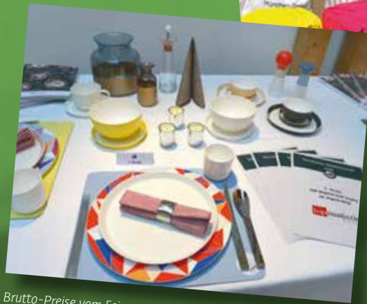
Brutto-Preise vom Feinsten: Jeder Sieger bekam ein Ritzenhoff Geschirr-Set