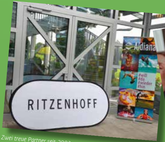
Zwei treue Partner seit 2003