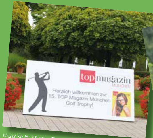
Unser Stolz: 15 Jahre TOP Trophy